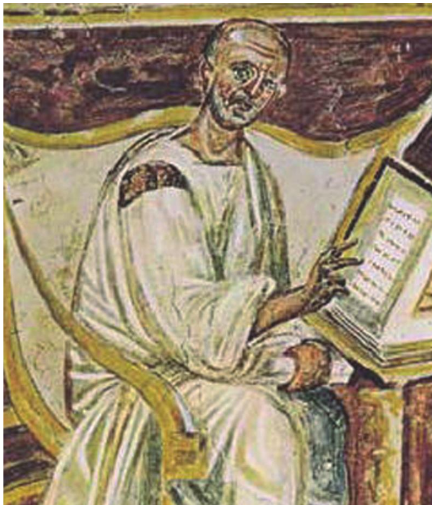
Det tidlegast kjende portrettet av Augustin, i ein freske frå 500-talet. Lateran, Roma