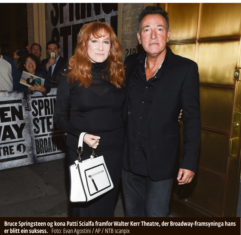
Bruce Springsteen og kona Patti Scialfa framfor Walter Kerr Theatre, der Broadway-framsyninga hans er blitt ein suksess.