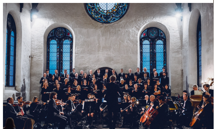
Collegium Músicŭms kor og orkester i Korskirken i Bergen.